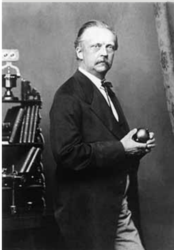
Hermann von Helmholtz

Metrologia unindo Indústria, Ciência Básica, Tecnologia, Inovação e Governo